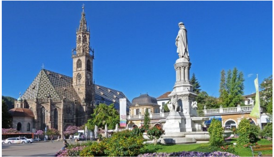
Bolzano – Piazza Walther