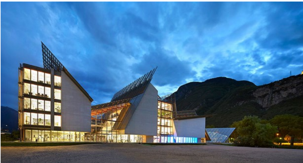
Trento – Muse (Museo delle Scienze)